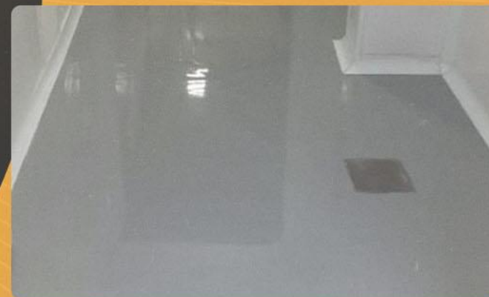
Polimento de piso.