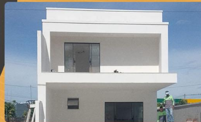
Pinturas em geral.