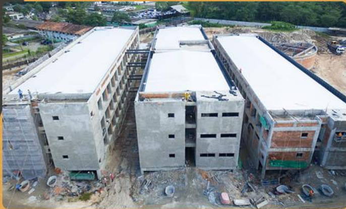
Reformas em Geral.