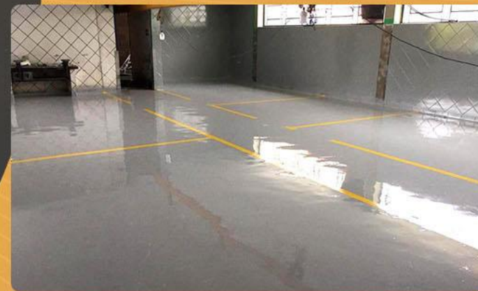
Piso com resina de epox.